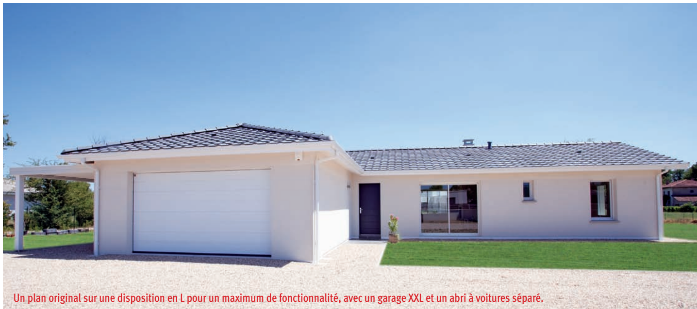
Un plan original sur une disposition en L pour un maximum de fonctionnalité, avec un garage XXL et un abri à voitures séparé.